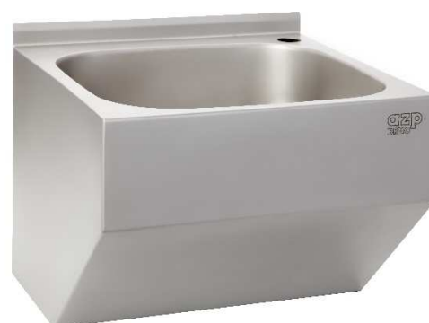
verze AUM 017