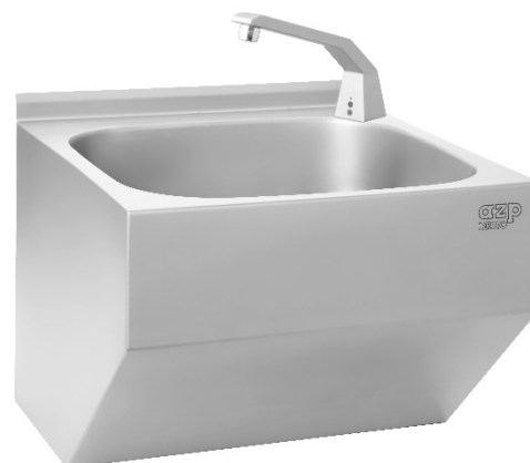
verze AUM 017.x

Umyvadla jsou vyrobena z nerezové oceli AISI 304.