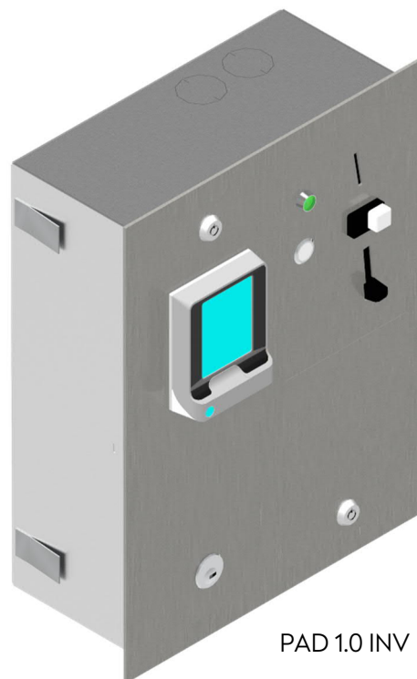
PAD 1.0 INV