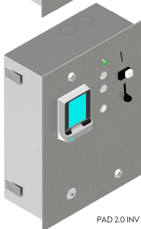
PAD 2.0 INV