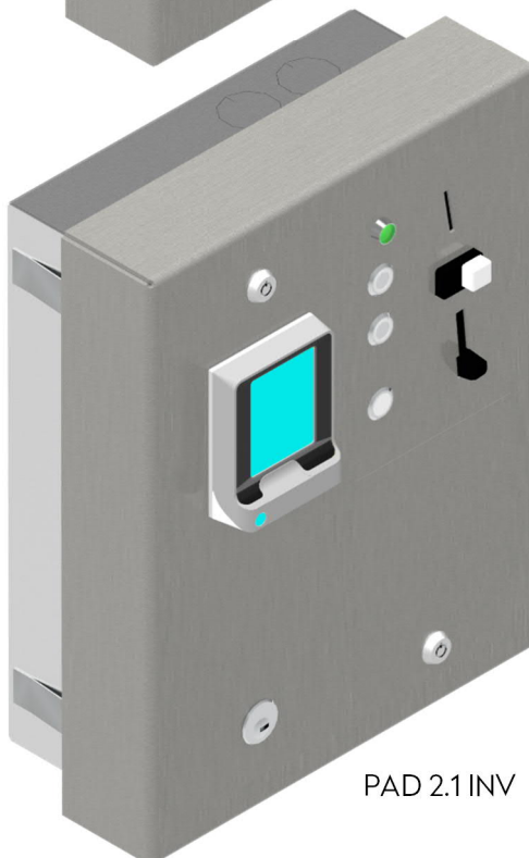
PAD 2.1 INV