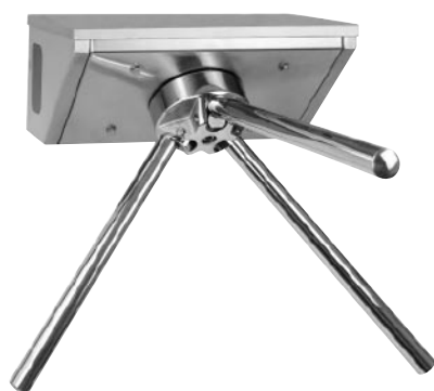
Turniket TRM 01